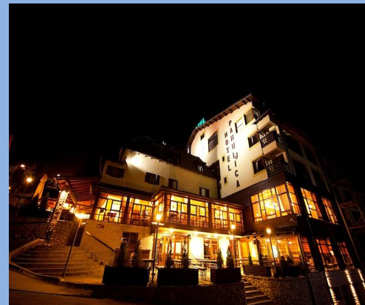
Hotel Pahuljica, Babanovac